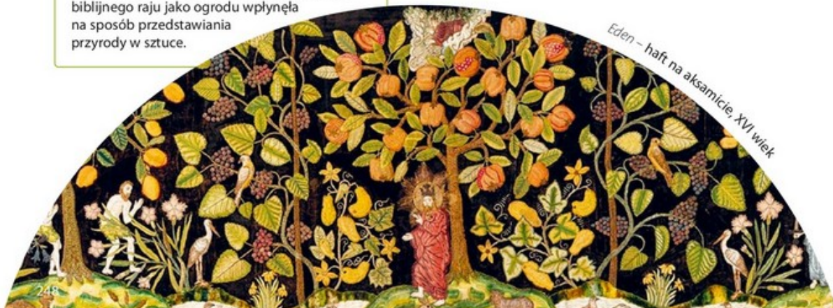
Eden – haft na aksamicie, XVI wiek

Liście, kwiaty i owoce to główne elementy haftu ukazującego rajski ogród – idealne miejsce, w którym Bóg umieścił człowieka, a następnie z powodu grzechu go stamtąd wygnał. Wizja biblijnego raju jako ogrodu wpłynęła na sposób przedstawiania przyrody w sztuce.